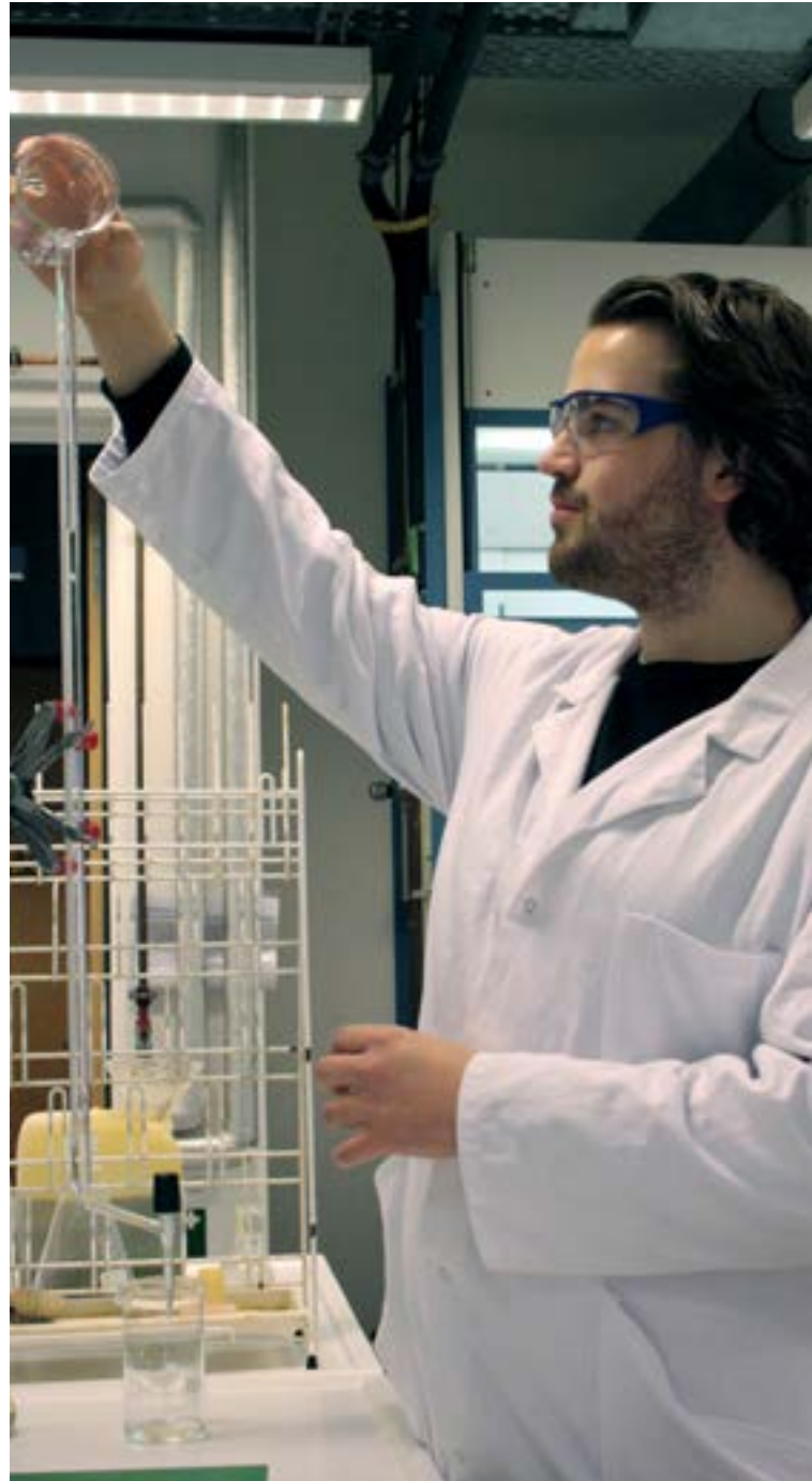
Das Arbeiten im Labor ist fester Bestandteil des Studiums

Neue Materialien können viele Beiträge zu einer nachhaltigen Wirtschafts- und Lebensweise leisten. Ansatzpunkt dazu gibt es entlang der gesamten Lebensdauer: von der Materialauswahl, ressourcenschonenden Herstellung, Verlängerung der Nutzungsdauer bis zu Recyclingprozessen.