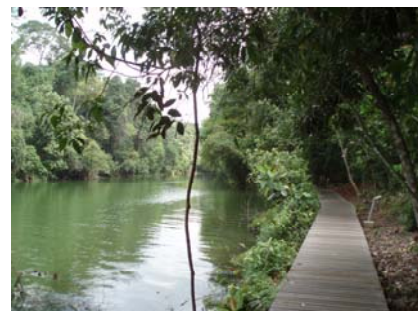
Abb. 17 TreeTop Walk Hängebrücke und Aussicht auf den Regenwald, rechts: Wanderpfad im MacRitchie Park