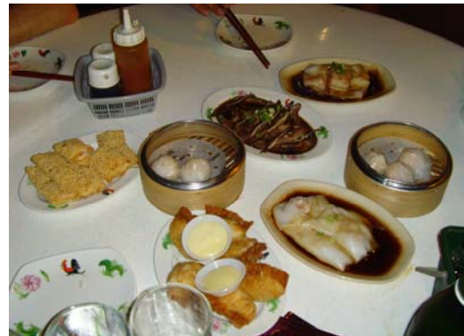
Abb. 4 links: Durian, rechts: typisches Dimsum