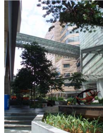
Abb. 2 links: Der Forschungsstandort Biopolis besteht aus sieben Gebäuden. Alle Gebäude sind über Sky-Brücken verbunden. Rechts: IBN ist im „Nanos“-Gebäude (hinten, orange)

Das Institut ist sehr international geprägt, sodass man Mitarbeiter aus Asien, Europa und Amerika kennen lernen kann. Auf die Hierarchie wird in Singapur als asiatischer Staat großen Wert gelegt und sollte respektiert werden. Mein Projekt habe ich in der Arbeitsgruppe Biosensors and Devices bearbeitet. Das Interesse unserer Gruppe liegt darin neuartige Mikrochip-basierte DNA-Synthese-Verfahren zu entwickeln. Ich habe daher vorwiegend mit Bio-Ingenieuren zusammen gearbeitet, was einerseits herausfordernd und andererseits sehr hilfreich und lehrend war. Im Labor war es nicht einfach einen sterilen Arbeitsplatz zu schaffen. Mit der Einstellung neuer Mitarbeiter und Praktikanten wurde mein Arbeitsplatz von vier weiteren Personen genutzt. Als Studentin der Molekularen Biologie konnte ich meine Erfahrungen, Kenntnisse und Ideen gut in die gemeinsamen Arbeiten der Gruppe integrieren. Für Ratschläge standen mir alle jederzeit zur Hilfe und nahmen sich gegebenenfalls viel Zeit für mich. Die Zusammenarbeit in meiner Arbeitsgruppe hat mir sehr gut gefallen, allerdings waren die Interaktionen zwischen den