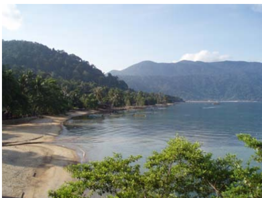
Abb. 23 Die Insel Tioman

Die Nachbarländer des Stadtstaates, Malaysia und Indonesien sind als Ausflugsziele sehr schnell und einfach zu erreichen. Die südlichste Stadt Malaysias ist einen Tagesausflug wert. Der Grenzübergang kann jedoch einige Stunden in Anspruch nehmen. Weitere sehr begehrte mehrtägige Ausflugsziele sind die Kolonialstadt Melaka, die naturbelassene Insel Tioman (eine der schönsten Inseln weltweit) und Pulau Redang. Pulau ist der malaiische/indonesische Begriff für Insel. Kuala Lumpur habe ich zwar auch besucht, jedoch ist diese Stadt meiner Ansicht nach nicht sehr abwechslungsreich.