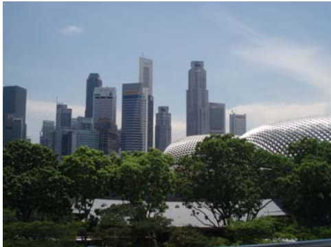
Abb. 16 The Esplanade

Eines der wohl interessantesten Gebäude ist das Operngebäude The Esplanade. Es wurde in der Form von zwei Hälften einer Durian konstruiert. Fast jeden Tag kann man in der Vorhalle einer Amateurband in einer entspannenden Atmosphäre zuhören. Ebenso kann man dort Veranstaltungen wie Theater, Konzerte und Tanzaufführungen besuchen.