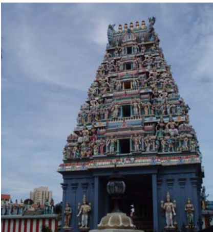
Abb. 9 Sri Sivan Tempel in Little India