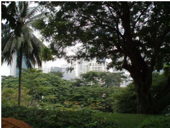
Abb. 13 Aussicht vom Fort Canning Park

Nicht weit vom Raffles Hotel liegt der Fort Canning Park. Ein Teil der Geschichte von Singapur und eine grüne Lunge warten hier. Damals galt dieses Fort der Verteidigung des Hafens Singapurs. Die beiden Kanonen konnten mit ihrer Reichweite feindliche Schiffe auf dem Meer beschießen. Heute dient dieser Berg auch als streng bewachtes Wasserreservoir.