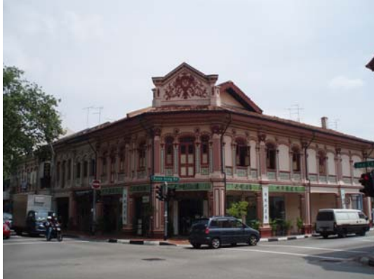
Abb. 18 Historisches Gebäude im Katong Stadtteil

Von dort aus geht es weiter in den East Coast Park, wo man an schönen Tagen viele Singapurianer beim Fahrradfahren beobachten kann. Viele Sportmöglichkeiten bietet der am Strand lang gezogene Park. Menschen unterschiedlichster Kultur teilen sich die Grillplätze und versuchen von dem rasanten Arbeitstag Abstand zu bekommen.