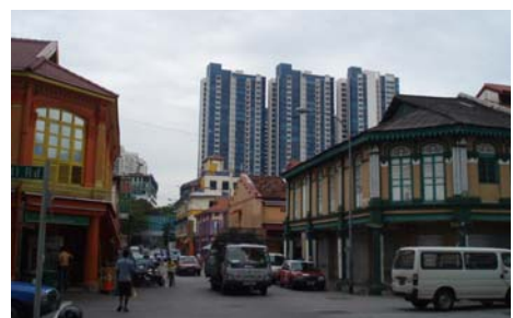
Abb. 11 Little India umgeben von modernen Hochhäusern

Die MRT Station Little India auf der North East Line ist ideal, um in den indischen Stadtteil von Singapur zu gelangen. Ein anschließender Abstecher in die Arab Street lohnt sich. Beide Regionen sind voller Sehenswürdigkeiten, Moscheen, Tempel und Geschäfte. Die Reiseführer von Dorling Kindersley und Marco Polo geben eine Übersicht der zu besichtigenden Orte, jedoch verraten sie nicht, dass sich der farbenfrohe Indische Markt direkt hinter der MRT Station Little India Race Course Road befindet. Jedoch ist dieser Markt nichts für jedermanns Nase und Geschmack. Die Textilien hängen in der intensiv nach Fisch und Fleisch riechenden Luft.