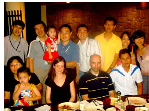
Abb. 3 Gemeinsames Abend-essen unserer Arbeitsgruppe im japanischen Restaurant Sakura

Das Institut ist sehr international geprägt, sodass man Mitarbeiter aus Asien, Europa und Amerika kennen lernen kann. Auf die Hierarchie wird in Singapur als asiatischer Staat großen Wert gelegt und sollte respektiert werden. Mein Projekt habe ich in der Arbeitsgruppe Biosensors and Devices bearbeitet. Das Interesse unserer Gruppe liegt darin neuartige Mikrochip-basierte DNA-Synthese-Verfahren zu entwickeln. Ich habe daher vorwiegend mit Bio-Ingenieuren zusammen gearbeitet, was einerseits herausfordernd und andererseits sehr hilfreich und lehrend war. Im Labor war es nicht einfach einen sterilen Arbeitsplatz zu schaffen. Mit der Einstellung neuer Mitarbeiter und Praktikanten wurde mein Arbeitsplatz von vier weiteren Personen genutzt. Als Studentin der Molekularen Biologie konnte ich meine Erfahrungen, Kenntnisse und Ideen gut in die gemeinsamen Arbeiten der Gruppe integrieren. Für Ratschläge standen mir alle jederzeit zur Hilfe und nahmen sich gegebenenfalls viel Zeit für mich. Die Zusammenarbeit in meiner Arbeitsgruppe hat mir sehr gut gefallen, allerdings waren die Interaktionen zwischen den