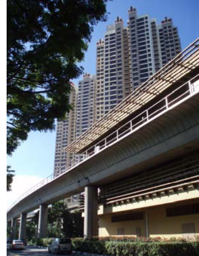
Abb. 6 MRT Station Commonwealth

Wer beeindruckende Condominiums betrachten und einen Abstecher in einen Gartenmarkt