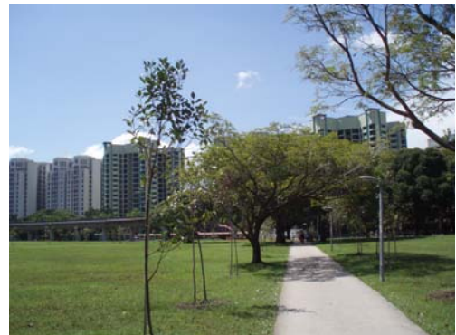
Abb. 1 links: typische HDB flats, rechts: Condominiums

Letztendlich habe ich in der Scholars Residence meinen Platz gefunden. Hier wohnten viele Studenten der National University Singapore oder der Nanyang Technical University. Informationen gibt es unter http://www.scholarslink.com/ .