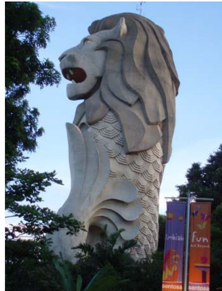
Abb. 5 Der Merlion als Wahrzeichen von Singapur ist auf Sentosa zu besichtigen.

Die Mischung der vielen Kulturen in der Vergangenheit und in der Gegenwart spiegelt sich in der Namensgebung von Singapur wieder. Der ursprüngliche Name lautet Temasek, was Stadt am Meer bedeutet. Eine Umbenennung hatte jedoch die Hintergründe einer Sage. Ein Prinz flüchtete nach Singapur und sah einen Löwen. Der Prinz wollte ihn erlegen, aber beide schauten sich nur in die Augen. Der Prinz lies sein Schwert sinken und der Löwe zog sich zurück. So entstand der Name Singapur aus den beiden Hälften Singa – Löwe und pura – Stadt. Dieses Wahrzeichen entwickelte sich weiter und vermischte sich. Der Merlion (Mermaid – Meerjungfrau, Lion – Löwe) ist als heutiges Wahrzeichen auf der Insel Sentosa zu besichtigen und als Aussichtsturm zugänglich. An der Sprache für die Benennung des Wahrzeichens kann man wieder die Geschichte entdecken. Singapura stammt aus der Zeit vor der Kolonialisierung (malaiisch), wobei Merlion aus der heutigen Zeit stammt (englisch).