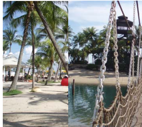
Abb. 22 Strandpromenade auf Sentosa und Hängebrücke zur Aussichtsplattform