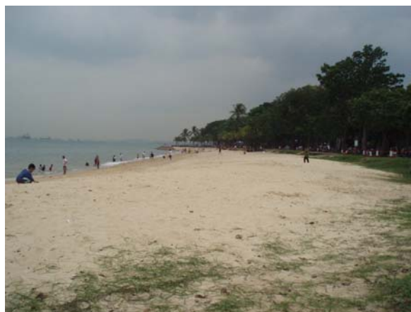
Abb. 19 East Coast Park