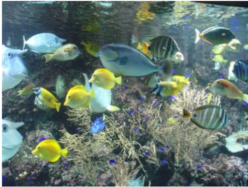
Abb. 21 Sea Live Center auf Sentosa

habe ich während meines Aufenthalts in Singapur die größte Ansammlung westlicher Touristen erlebt.