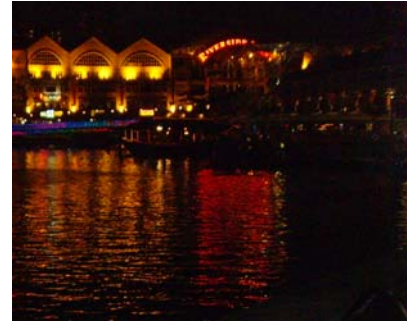
Abb. 15 Singapore River

Auch in der Dunkelheit ist dieser Teil von Singapur eine wahre Augenweide.