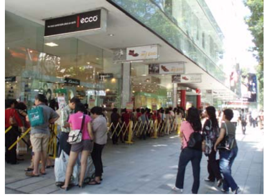
Abb. 8 Shoppingmeile Orchard Road und anstehende Singapurianer vor einem Kaufhaus