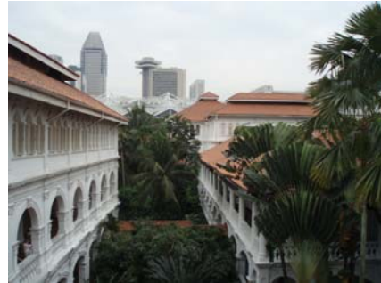
Abb. 12 Raffles Palace

Der Raffles Palace ist der Ort an dem Sir Thomas Stamford Raffles seine erste Niederlassung auf Singapur gegründet hat. Demnach ist es nicht verwunderlich, dass dies nun ein Hotel und Café ist und ein kleines Museum aus Bildern von Singapurs Anfängen für alle zugänglich ausstellt.