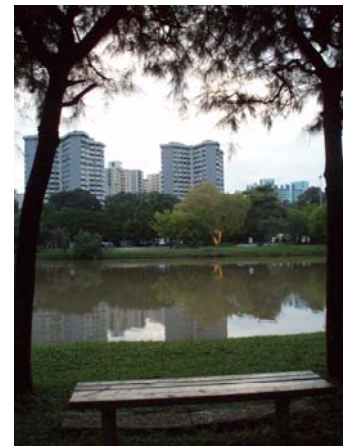
Abb. 20 Chinese and Japanese Garden