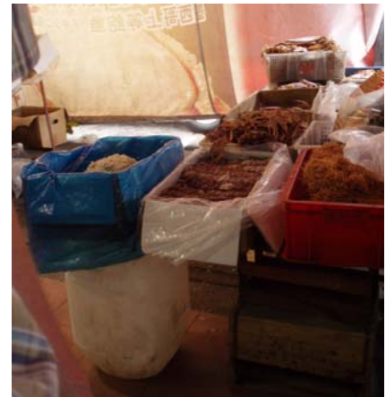
Abb. 10 Allerlei getrocknete Fleischwaren

Die MRT Station Little India auf der North East Line ist ideal, um in den indischen Stadtteil von Singapur zu gelangen. Ein anschließender Abstecher in die Arab Street lohnt sich. Beide Regionen sind voller Sehenswürdigkeiten, Moscheen, Tempel und Geschäfte. Die Reiseführer von Dorling Kindersley und Marco Polo geben eine Übersicht der zu besichtigenden Orte, jedoch verraten sie nicht, dass sich der farbenfrohe Indische Markt direkt hinter der MRT Station Little India Race Course Road befindet. Jedoch ist dieser Markt nichts für jedermanns Nase und Geschmack. Die Textilien hängen in der intensiv nach Fisch und Fleisch riechenden Luft.