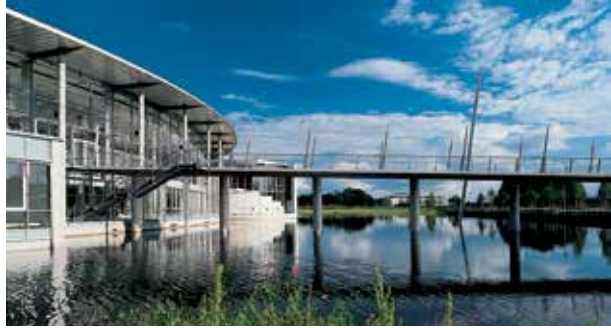
Westfälische Hochschule, Standort Bocholt