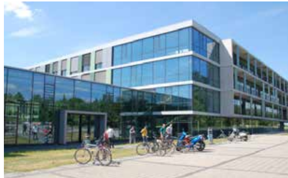
Westfälische Hochschule, Standort Gelsenkirchen

Das Westfälische Energieinstitut (WEI) ist eine zentrale wissenschaftliche Einrichtung der Westfälischen Hochschule und bündelt die energietechnischen Kompetenzen der Hochschule über die Standorte und Fachbereiche hinweg.