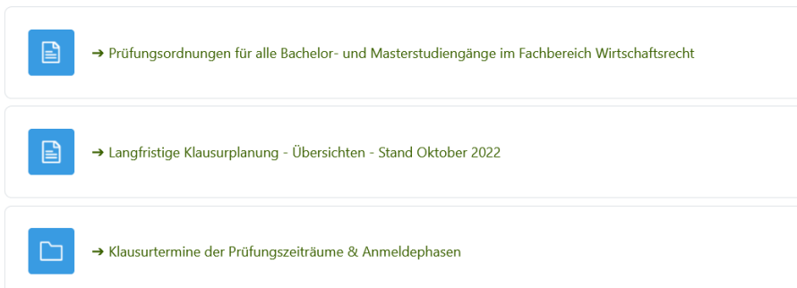
Abbildung 6: Auszug des Bereichs Prüfungen im Moodle-Kurs Information für Studierende

Die Anmeldezeiträume zu den Prüfungen werden immer am Anfang des Semesters im Oktober für die Prüfungen im Januar und März sowie im April für die Prüfungen im Juli und September vom Fachbereich über den Moodle-Informationskurs bekannt gegeben und sind zwingend einzuhalten. Zudem erhalten Sie hier weitere Informationen zu den Prüfungen und erlaubten Hilfsmitteln.