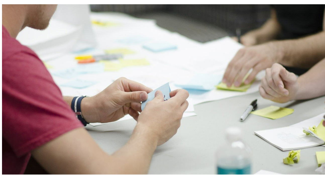
Interaktiver Workshop