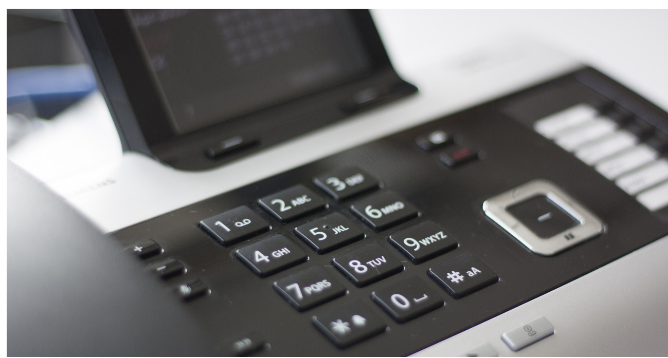
Die bisherige Vorgehensweise