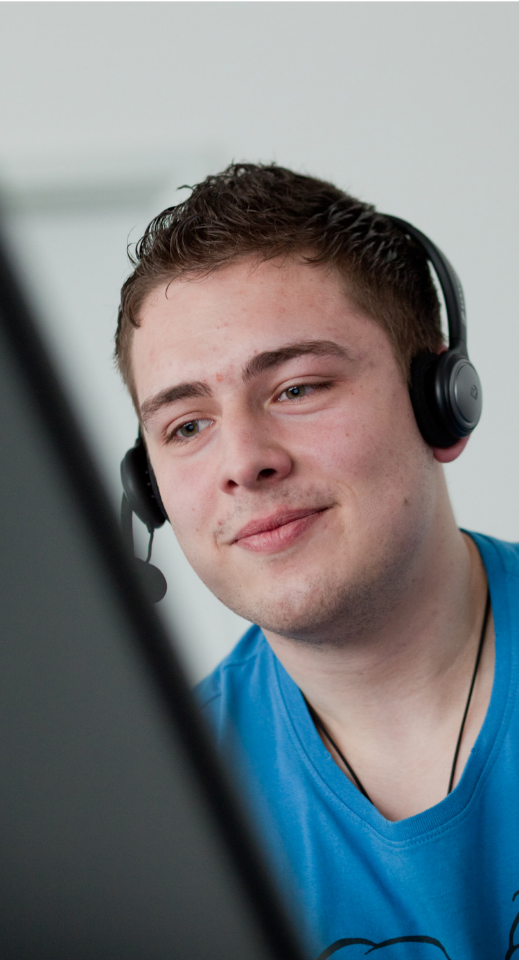
Seminar im PC-Pool

Im sechsten Semester findet dann eine 14-wöchige Praxisphase außerhalb der Hochschule statt. Dort erhältst du die Gelegenheit, das zuvor Gelernte in der betrieblichen Praxis umzusetzen. Das Studium schließt mit der 10-wöchigen Bachelorarbeit ab, die in der Regel in Kooperation mit einem Unternehmen durchgeführt wird.