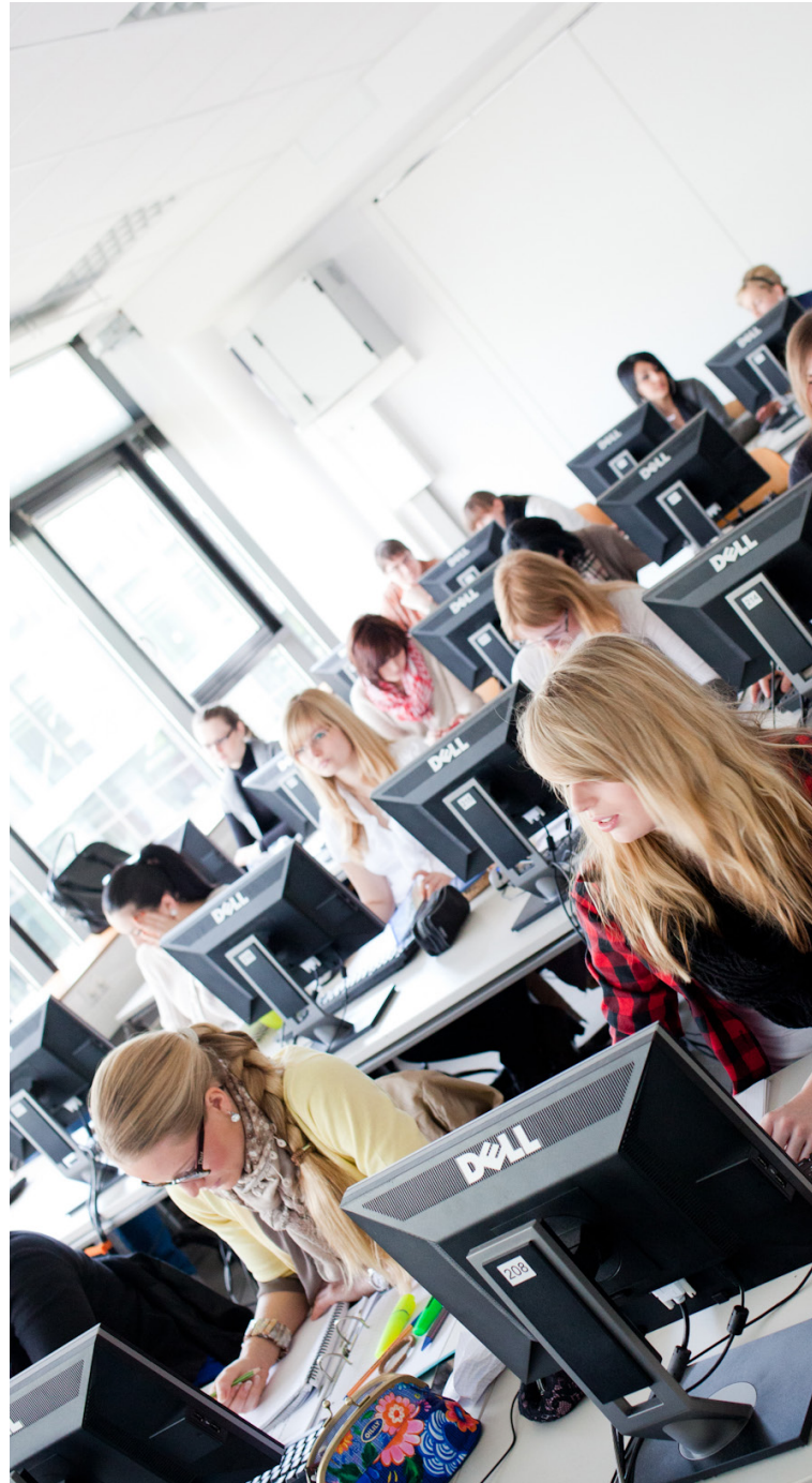
Studierende des Studiengangs Wirtschaft im PC-Pool