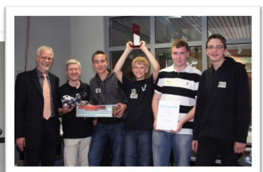
Fotos von vergangenen Wettbewerben